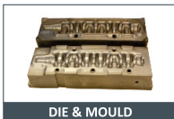
DIE & MOULD